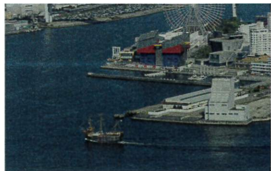
「海遊館とサンタマリア号」

天保山のサンタマリア号は、コロンブスのサンタマリア号の約2倍の大きさで復元された観光船です。 西座新二会員