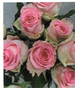
ブリジットバルドー