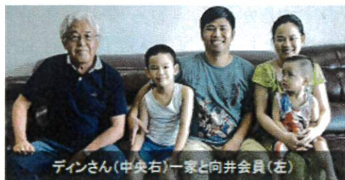
ディンさん(中央右)一家と向井会員(左)